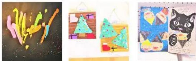
昨年2020年開催の第18回アガッセ作品展出品作品