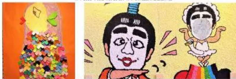
昨年2020年開催の第18回アガッセ作品展出品作品