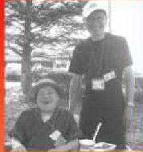
利用者さんのお手伝い